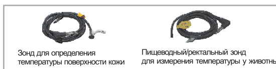
Зонд для определения температуры поверхности кожи

Ток возбуждения : постоянный ток 100 мкА Датчик : термистор 2252Ом@25°C Диапазон : 32°C~42°C Чувствительность : 0.1°C