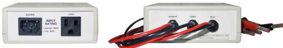
задняя (на рис. слева) и передняя панель

Для измерения параметров 3Ф нагрузки (тип Треугольник или Звезда/ Delta or Star type ) подключение АКИП-2502 в линии R, S, T сети выполняется по следующим схемам соединения (соответственно):