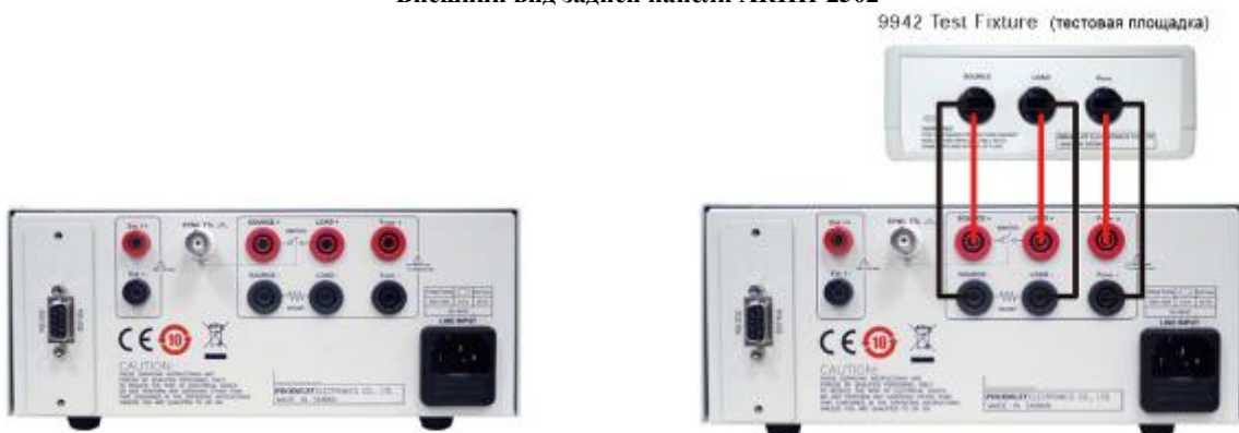
На рис. справа – подключение AC нагрузки с помощью опциональной тестовой площадки 9942